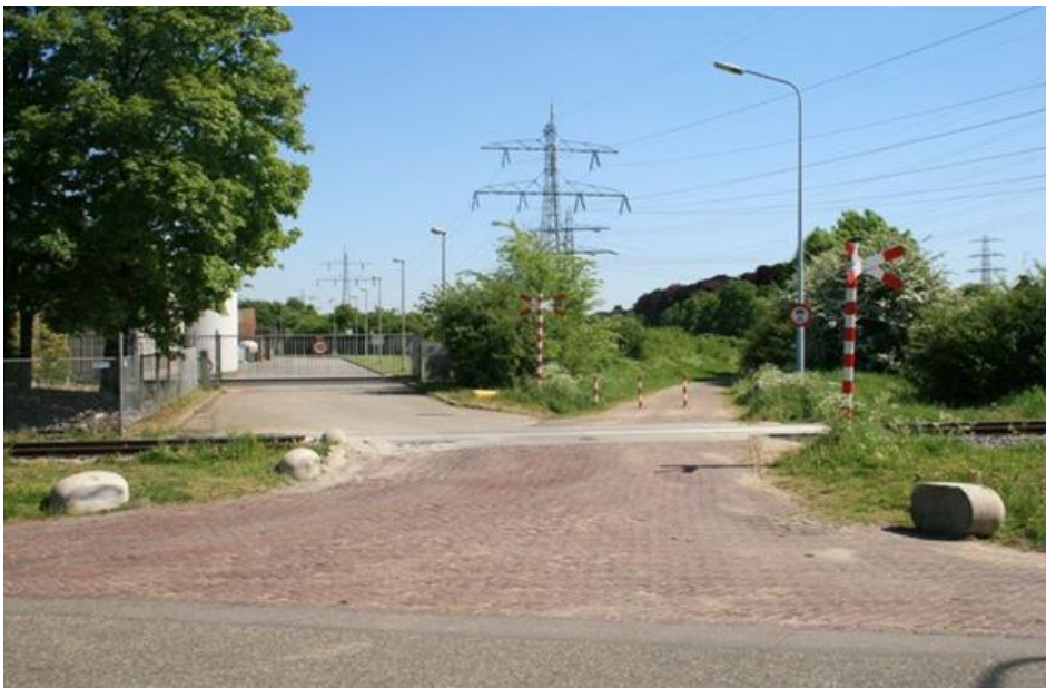
Foto 4 – Zuidwestzijde overweg in de Limmelderweg, lijncode 814, km 100.320, oorspronkelijke situatie.

Handhaving van de overweg in de Fregatweg met plaatsing van een vri, handhaving van de overweg in de Limmelderweg, lijncode 814, onder voorwaarde dat de huidige functie van die overweg, toegang tot de Mora en beschikbaar voor fietsverkeer, niet wordt uitgebreid. Er komt geen overweg Kraakweg en geen overweg in de Verlengde Beukenlaan.