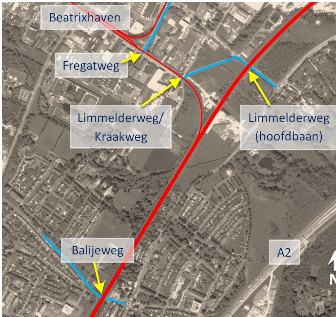
Foto 1 – Spoorlijn Maastricht – Sittard (dikke rode lijn) en gebied Beatrixhaven linksboven.