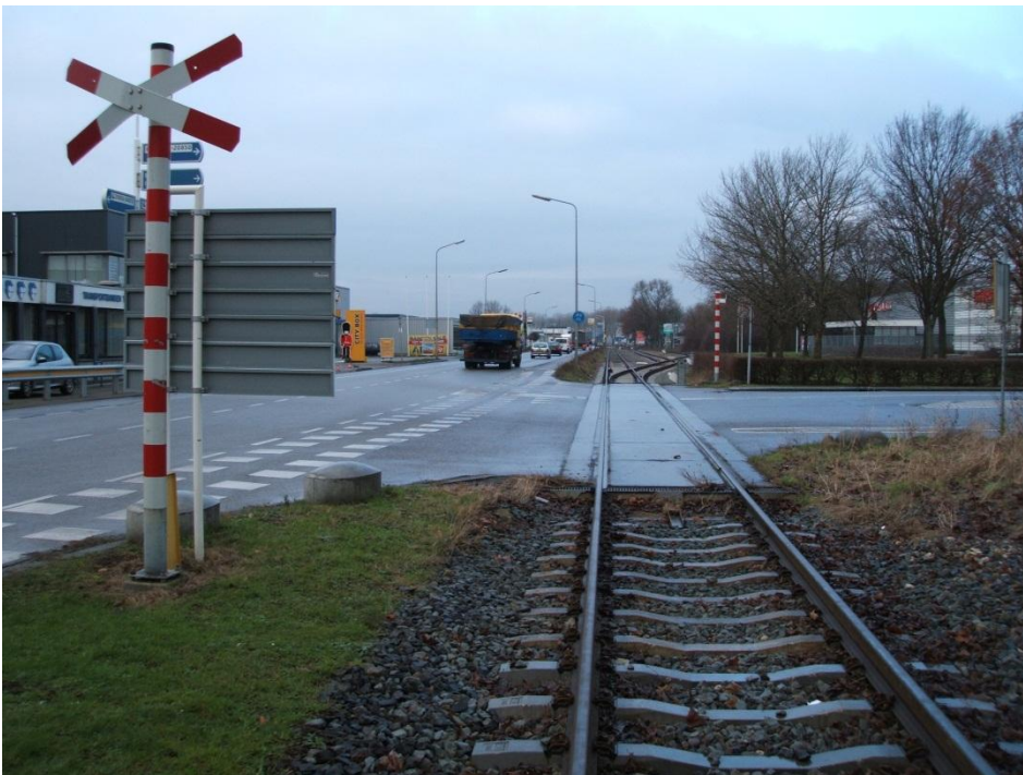
Foto 6 – Oostzijde overweg naast kruising Fregatweg (rechts) en Galjoenweg (links) lijncode 814, km 100.525.