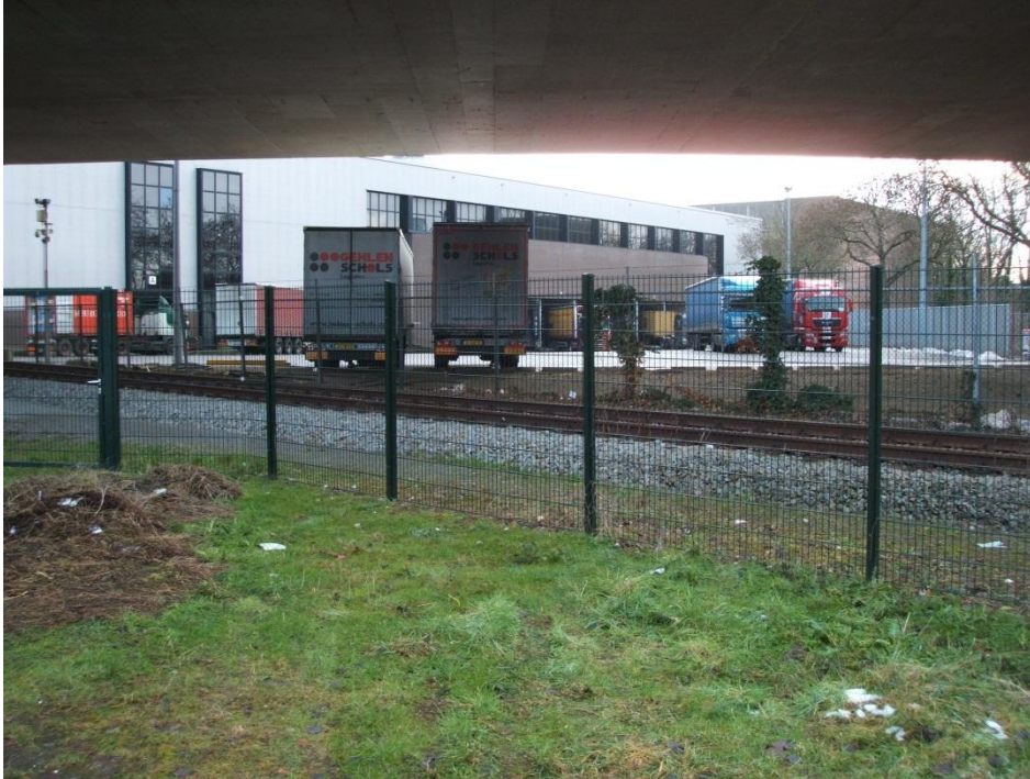
Foto 7 – Noordzijde locatie nieuwe overweg naar Sappi, lijncode 072, km 37.600.

De analyse van de nieuwbouw van de overweg in de toegang naar Sappi is beschreven in de “Risicoanalyse overweg Sappi Maastricht” [03]. Op basis van die risicoanalyse komen wij tot de conclusie dat de aanleg van deze overweg, hoewel deze wordt voorzien van een Ahob, zal leiden tot een hoger risico op het gebied van overwegveiligheid.