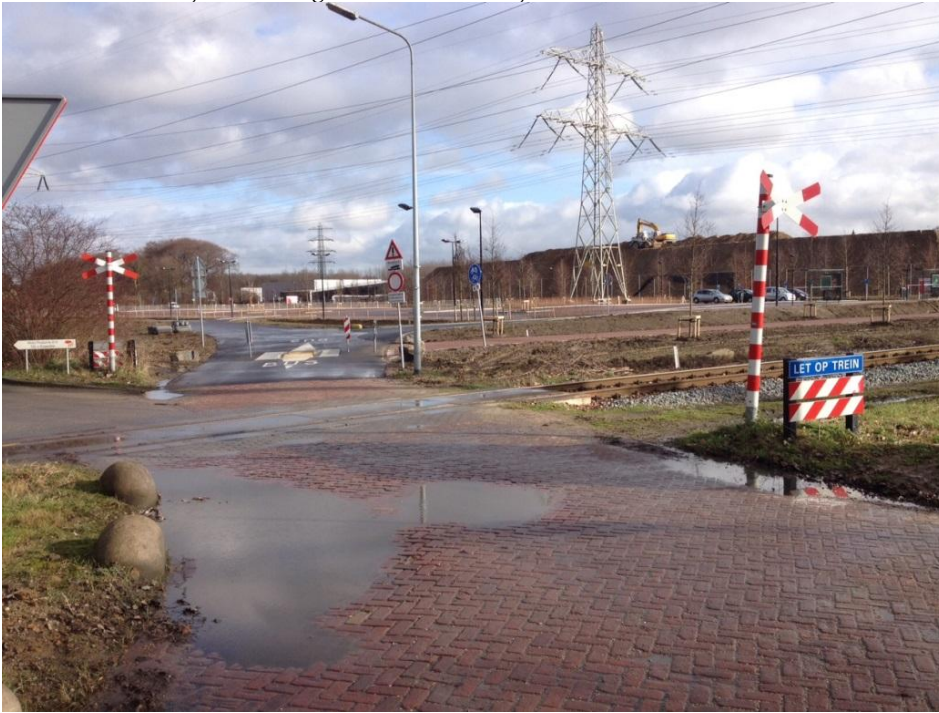
Foto 5 – Zuidwestzijde overweg in de Limmelderweg, lijncode 814, km 100.320, huidige situatie met busroute.

In afwachting van een definitieve beslissing over de situatie in de Beatrixhaven kan de busroute wel worden gedoogd. De gemeente heeft aangegeven dat het busverkeer plaatsvindt tijdens koopavonden en in het weekend, tijden dat er geen treinverkeer rijdt.